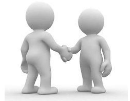
Eerste convenant gebiedsgericht grondwaterbeheer

Op 8 juli werd voor het eerst in Nederland een convenant gebiedsgericht grondwaterbeheer ondertekend. Hiermee leggen de tien partijen hun afspraken vast over het grondwaterbeheer in het Gooi. De overheidspartijen dragen financieel bij, de waterleidingmaatschappijen en waterschap in natura. Provincie Noord-Holland is initiatiefnemer en trekker van dit grondwaterinitiatief. Bodemzorg ondersteunt de provincie met advies en communicatie.